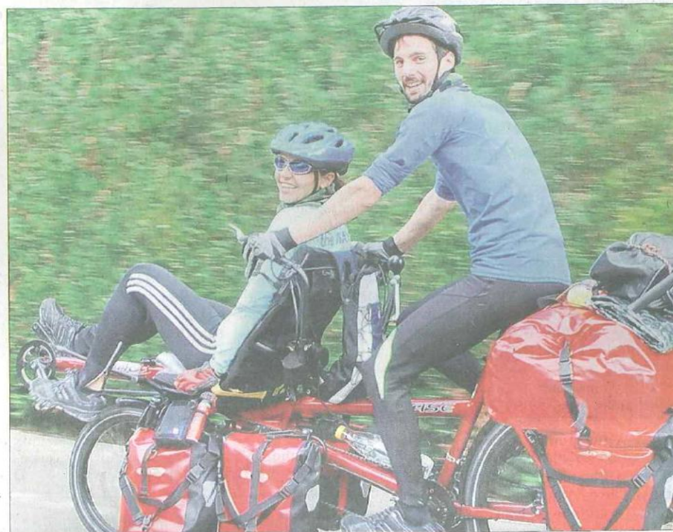
À bord de leur tandem couché/debout "Ice-breaker", le couple a parcouru l'Europe, faisant des rencontres humaines et animales aussi insolites qu'inoubliables.

ne dormaient pas chez l'habitant, ils campaient, parfois dans des conditions difficiles, comme lors des fortes pluies en Italie ou lorsque des sangliers rodèrent autour de leur tente en République Tchèque. Autant de souvenirs qui resteront gravés dans leur mémoire.